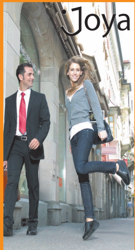
Der weichste Schuh der Welt!